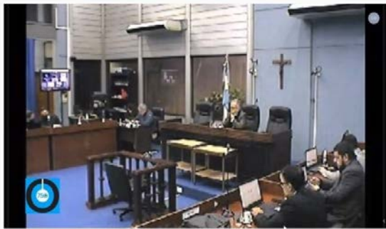
Juicio Por Lesa Humanidad "Megacausa 14" en TOCF Tucuman Junio 2020

Foto 01. Tribunal de Tucumán. Causa Operativo Independencia. 25 de junio.